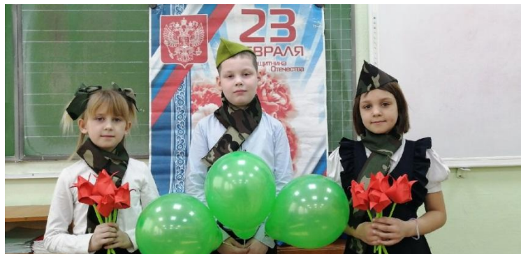
С уважением 1-Б класс.

Родина-мать – это святое, это наша земля, где мы родились, выросли, где живут дети и взрослые. Где трудятся люди, растят хлеб, учатся... Это святой клочок земли. «Родину-мать умеи защищать», «Кто за Родину дерётся, тому и сила двойная даётся».